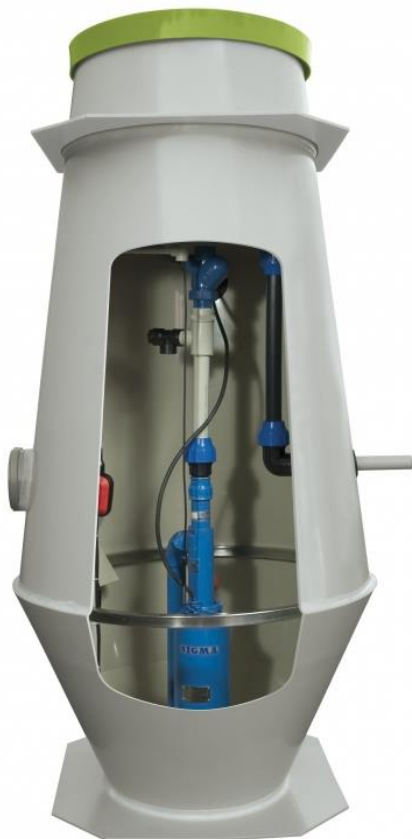
Obrázek 2: Čerpací jímka s čerpadlem

Pan starosta sdělil, že poptal studii na kanalizaci celého Dubence. Pokud bychom realizovali tlakovou kanalizaci s centrální ČOV pro ekvivalent 900 obyvatel, tak celá investice by nás dle studie proveditelnosti vyšla na 51.438.189,- Kč vč. DPH. To v ekonomických ukazatelích investičních nákladů činí 61.079,- Kč na obyvatele, v rámci žádosti o dotaci je tento údaj příznivý, protože maximální výše ukazatele činí 80.000,- Kč, pokud by se podařilo sehnat všechny dotace, tak by výsledným nákladem pro obec byla cena 10.288.189,- Kč.