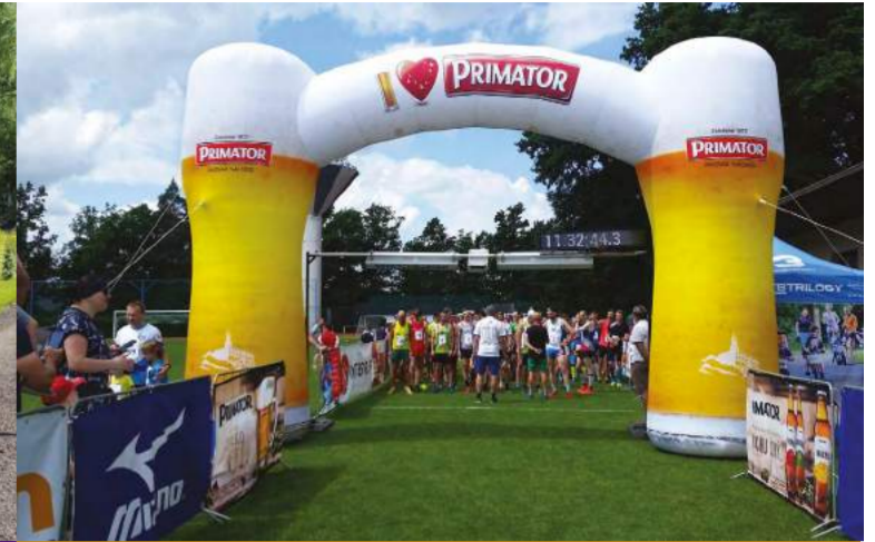
Velichovky: Velichovská sedmička