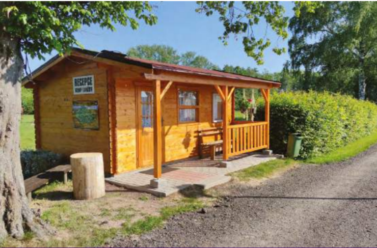
Lanžov: Zprávy z kempu