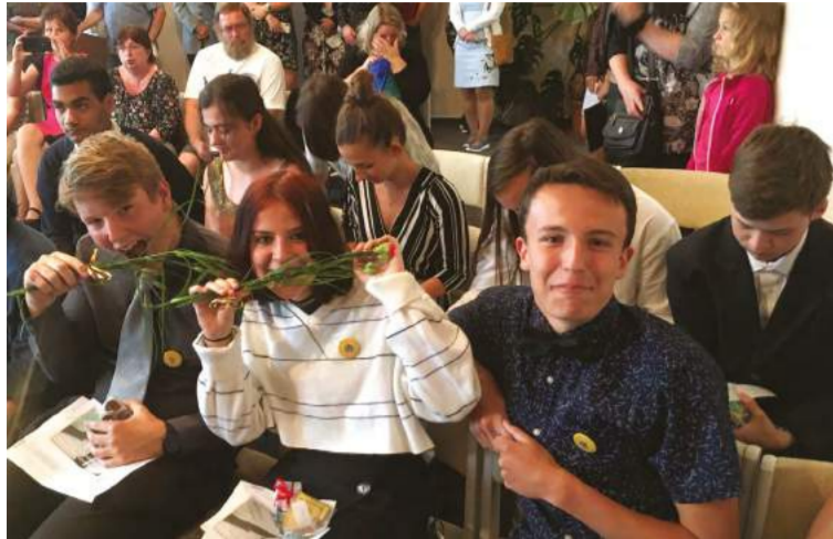
Dubec: Slavnostní rozloučení s absolventy